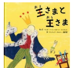
王さまと王さま：絵本ナビより引用

また、制服のある学校ではジェンダーにとらわれず生徒が着たいと思う制服を選択出来たり、「ALL GENDER」という誰が使用しても良いトイレが出来たりしています。身近な所で多様性を探したり、絵本から考えたりすると新たな発見があるかもしれません。