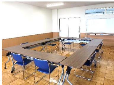
キョクトウとちぎ蔵の街楽習館