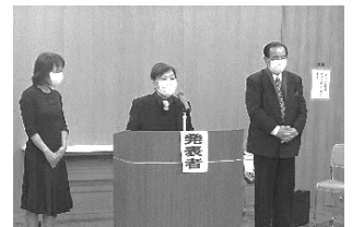
ネットワークとちぎ