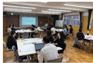
研修会「こども食堂でつくるあたたかい地域」

持続可能な開発目標 (SDGs) 地球の限界や人権の危機に対して国連総会で採択された17の行動目標