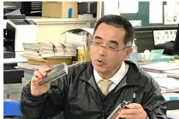
▲ドイツの鉄道旅行についてお話していただきました。