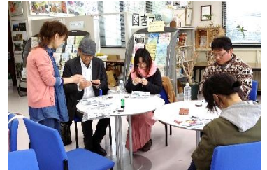
▲みんなでブルーランタンづくり。