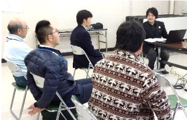
▲日ごろからお金について家族や身近な人と話しておくことが大切。