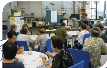
ん〜ん♪ 美味しい!! みんなニコニコ