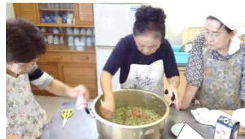
午前中から集まっての下準備。企画したメンバーの息もぴったり!

今回は、だし作りの達人にお話を伺いながら、また、実際に野菜の切り方を実演していただきながら、できあがったばかりの『だし』をいただきました。そして、お土産もいただき、みんなで美味しく健康的な交流サロンになったのでした。ご参加くださった皆さま、企画のハーモニーの皆さま、有難うございました!