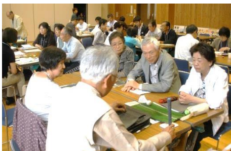
登録団体同士の交流