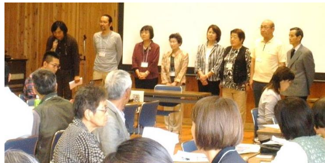
昨年の全体会議のようす（新役員の紹介）