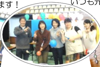
←パソコン要約筆記