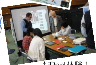
↑iPad体験！ ↓歌麿と栃木 くらら↓