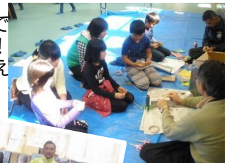
子ども達に人気のロケット作り